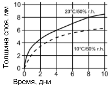
Диаграмма 1: скорость отверждения Sikaflex®-552 AT.

Отверждение Sikaflex®-552 AT происходит под воздействием атмосферной влаги. При низкой температуре содержание влаги в воздухе снижается, что приводит к замедлению процесса (см. диаграмму). Если материал используется в сочетании с полиуретановыми клеями или герметиками последним необходимо дать полностью полимеризоваться перед нанесением Sikaflex®-552 AT.